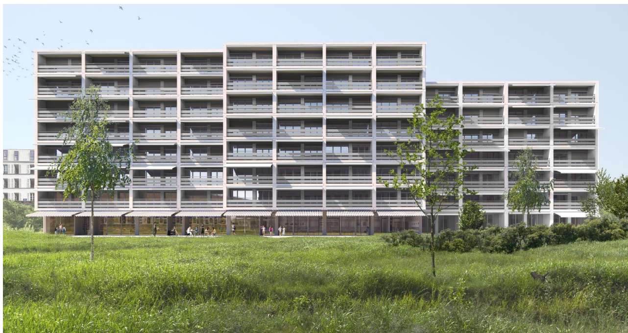
Chavannes-près-Renens (VD) – Rue de la Blancherie 14-24 (image de synthèse du projet de rénovation)

Lausanne, le 3 février 2025 – Deux immeubles appartenant au fonds Solvalor 61 vont être rénovés ces prochains mois à Chavannes-près-Renens (VD), dans l'agglomération lausannoise. Ces travaux permettront d'améliorer leur efficacité énergétique et de réduire leurs émissions de CO 2 , conformément à la stratégie du fonds. En outre, elles s'inscrivent dans une perspective de création de valeur durable en renforçant l'attractivité de ces immeubles pour les locataires.